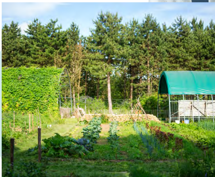
LES JARDINS PARTAGÉS DU PARC FORESTIER

« Des jardins partagés permettent aux habitants de cultiver des fruits et légumes tout au long de l'année. » »