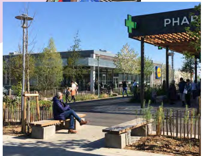
CENTRE COMMERCIAL DE LA CASCADE À LAXOU ET MAXÉVILLE, DES BOUTIQUES EN BAS DE CHEZ VOUS.