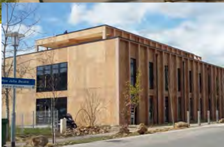
EMPLOI, DYNAMISME, LA ZONE D'ACTIVITÉS FAIT PARTIE DES ATOUTS DU PLATEAU DE HAYE.