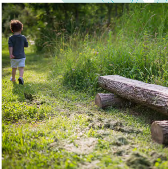
LE PARC FORESTIER DU PLATEAU

« Cette place centrale de l'arbre favorise également la biodiversité en ville et offre durant l'été des îlots de fraîcheur. »